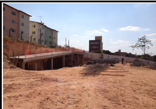
Rampa Fundos Desforma