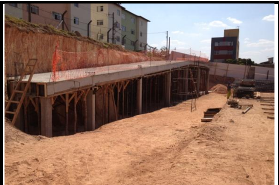
Rampa Fundos Desforma