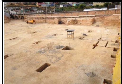
Escavação dos Blocos Prédio 1