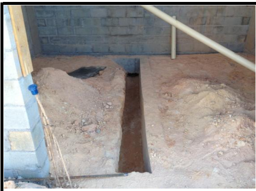
Sistema de Escoamento Contenção Prédio 4