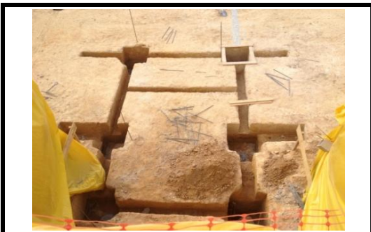
Escavação dos Blocos/Cinta Prédio 1