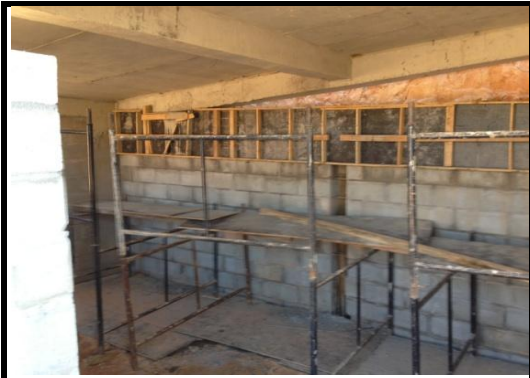
Fechamento Prédio 4