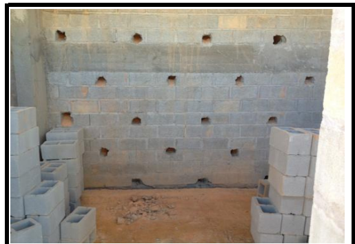
Sistema de Escoamento Contenção Prédio 4