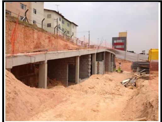
Fechamento Prédio 4