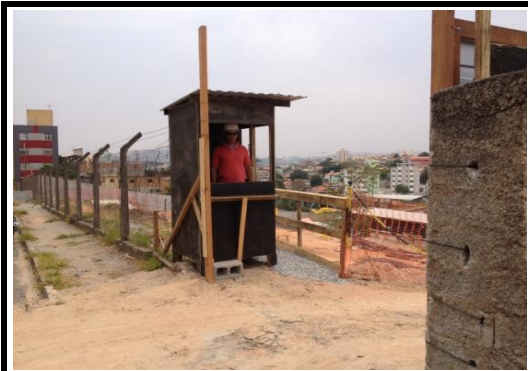
Nova Portaria com Guarita