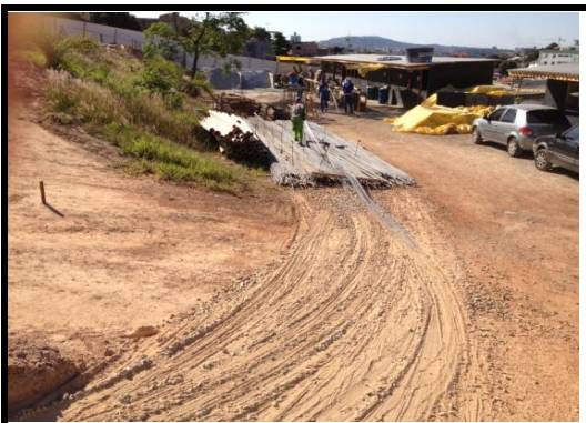
Estocamento do Aço Fundação