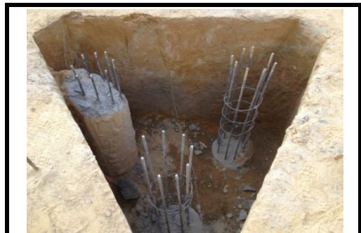
Escavação dos Blocos Prédio 1